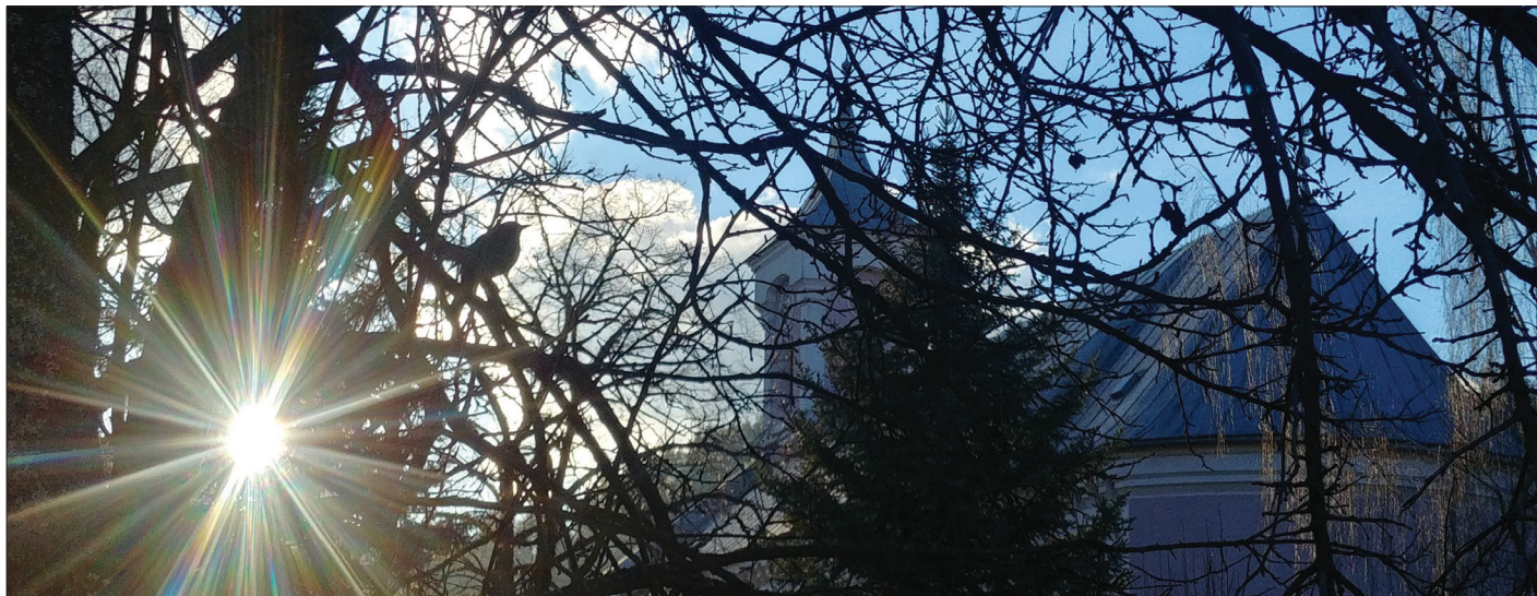
Aj vtáča našlo si domov...