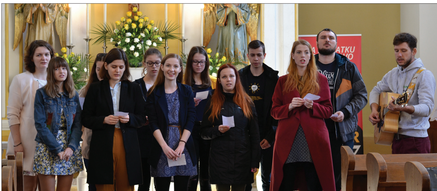
z vystúpenia mládeže počas Veľkého piatka * foto: Milada Fojtiková