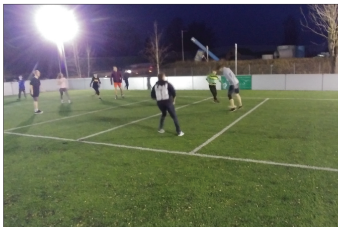
z futbalového zápasu medzi mladými z Lazov, Sučian a Krpelian