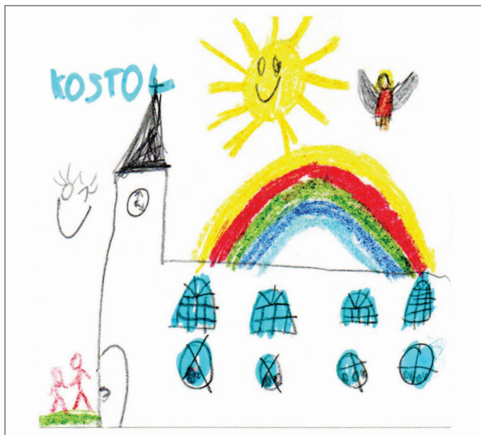
z ilustrácií na hodinách evanj. náboženskej výchovy * Viktória Gabrišová