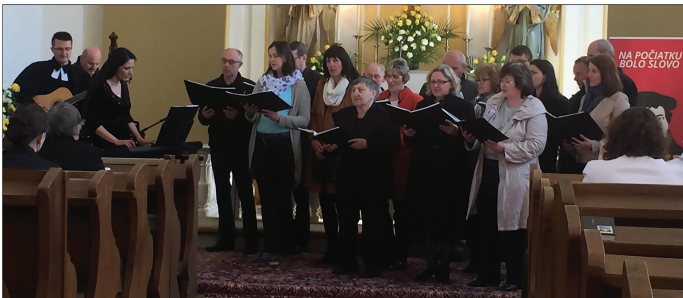
z vystúpenia spevokolu Prameň počas Veľkého piatka s piesňou „Golgota“