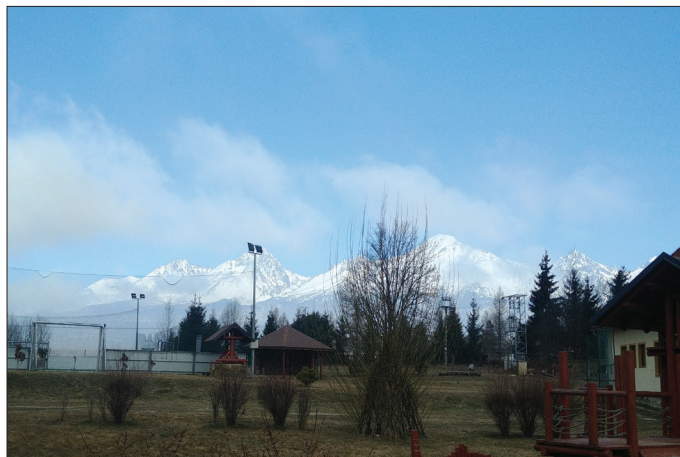
z konfirmačnej vikendovky v Memc Ichythys vo Veľkom Slavkove