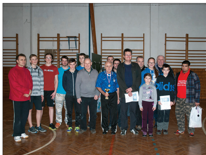
* turnaj o Pohár Augusta Roya v stolnom tenise, - foto: Pavel Putala

Na Veľký piatok a I. slávnosť veľkonočnú vystúpi počas služieb Božích spevokol Prameň. Na II. slávnosť veľkonočnú vystúpi s piesňou náš dorast a mládež.