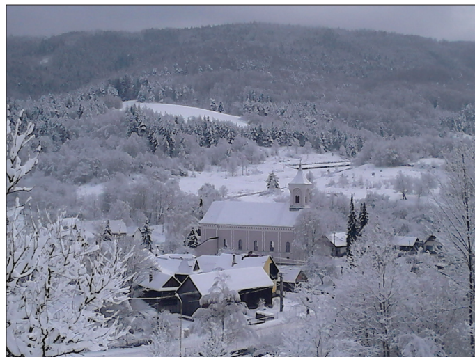
* pohľad na kostol a obec