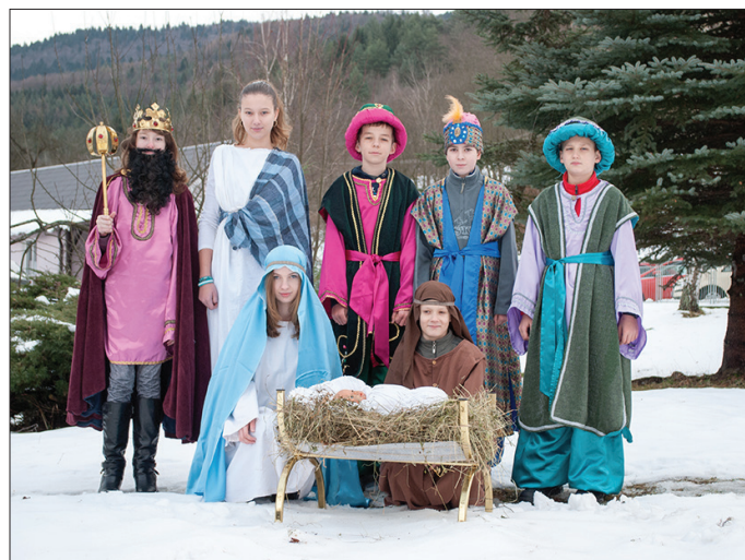
* divadelná scéna "Mudrci pred kráľom" - foto: Marek Tvarožek