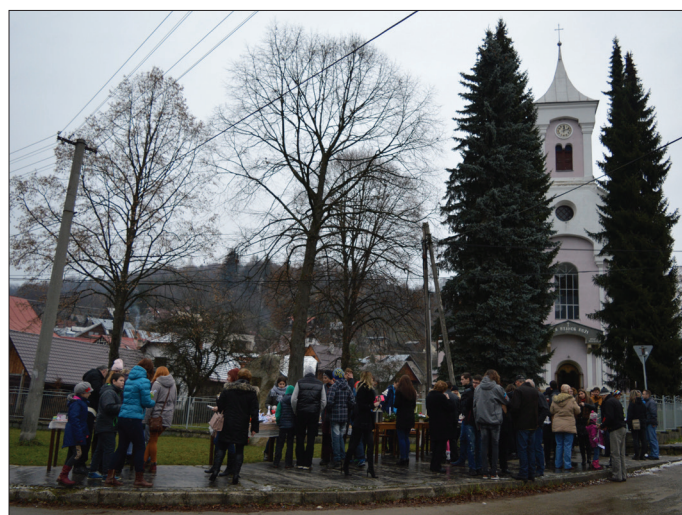
* z II. vianočných trhov, ktoré pripravila naša mládež, 29. november