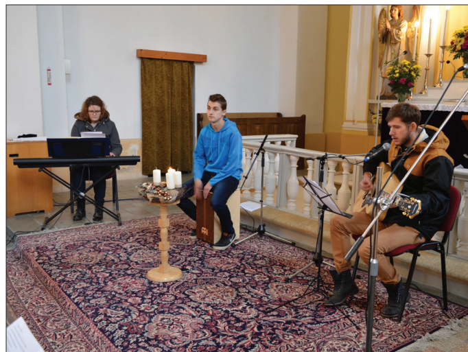
* z mládežníckych služieb Božích počas I. nedele adventnej - hudobníci

▪ vo vestibule nášho chrámu je možné uhradiť si cirkevný príspevok vo výške 4 € na osobu. Cirkevný príspevok je možné uhradiť si aj v zborovej miestnosti, v piatok, 18. decembra od 08.00 - 15.00hod. a v sobotu, 19. decembra od 08.00 - 17.00hod.